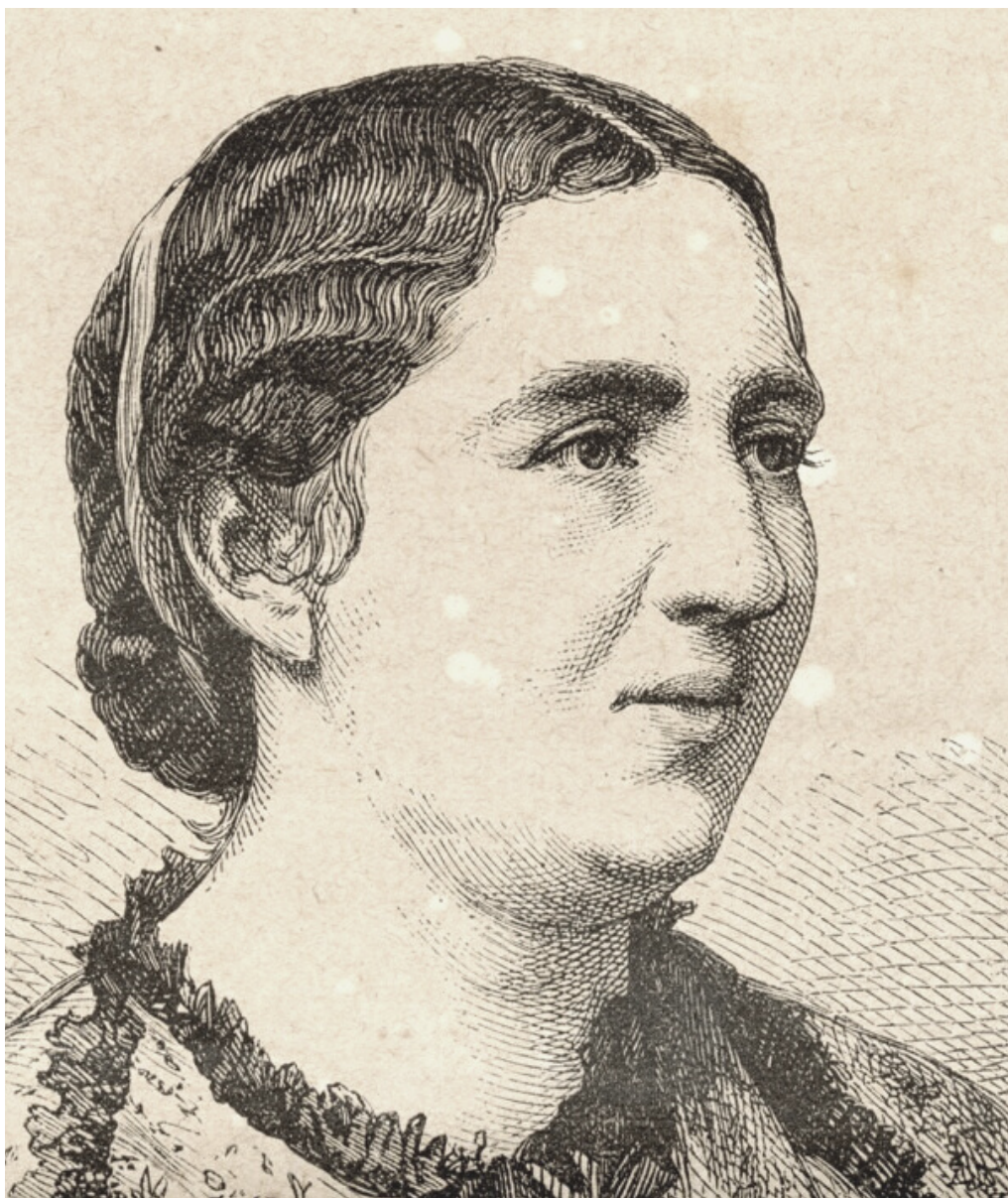
Foto: Die Gartenlaube (1871), Nr. 49, S. 817. Urheber: A. Neumann